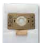
1 x sac microfibre